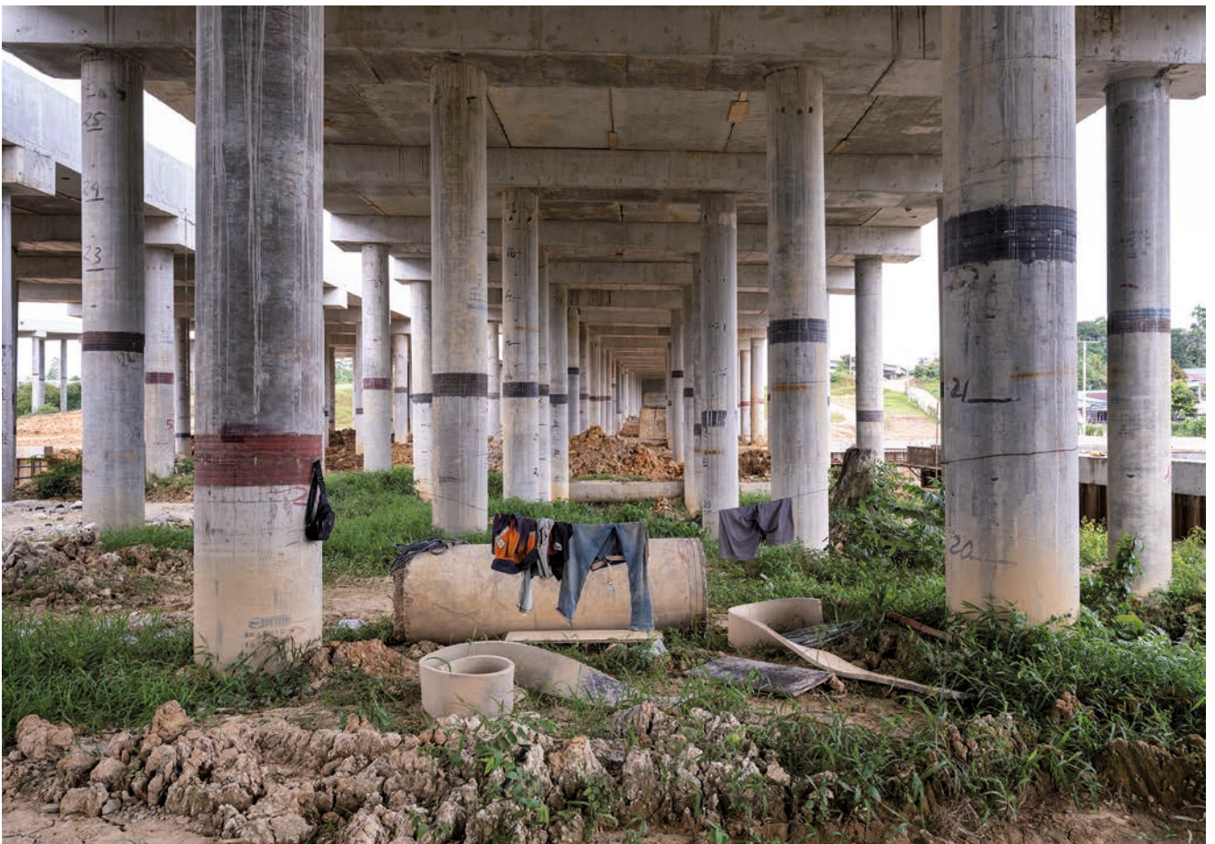
Spuren menschlichen Lebens zwischen den Säulen der zukünftigen Autobahn nach Nusantara.