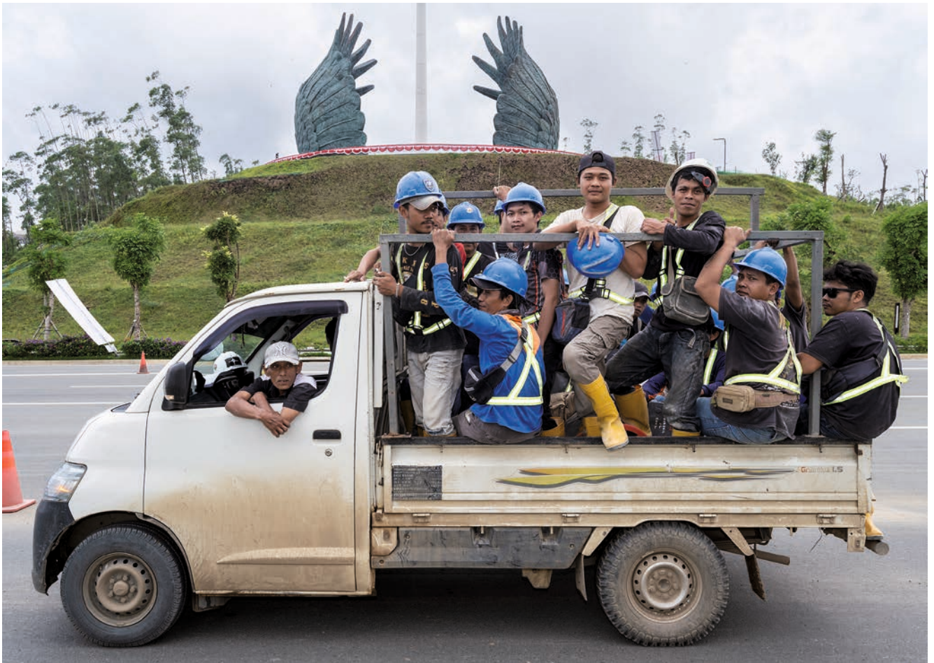
Aufbruchstimmung: Für die Bauarbeiter ist Nusantara das Versprechen eines besseren Lebens.