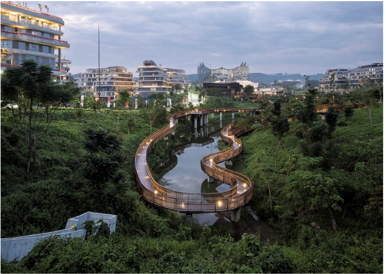
Wohnbauten und spielerisch geschwungene Spazierstege im Regierungsviertel Kipp.