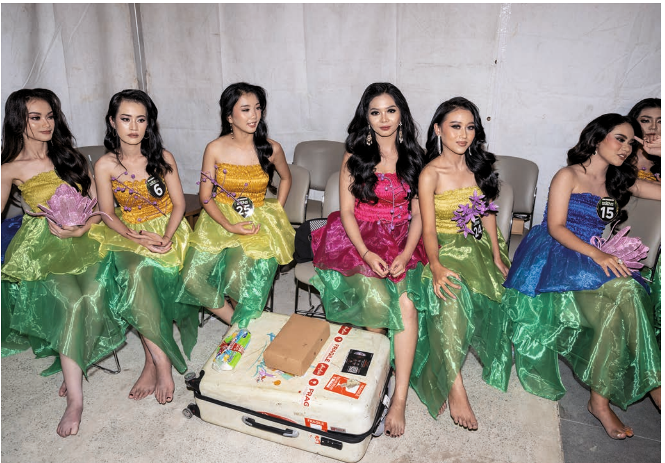
Wer ist die Glamouröseste in ganz Nusantara? Casting-Teilnehmerinnen an einem Kulturfestival im Dschungel.