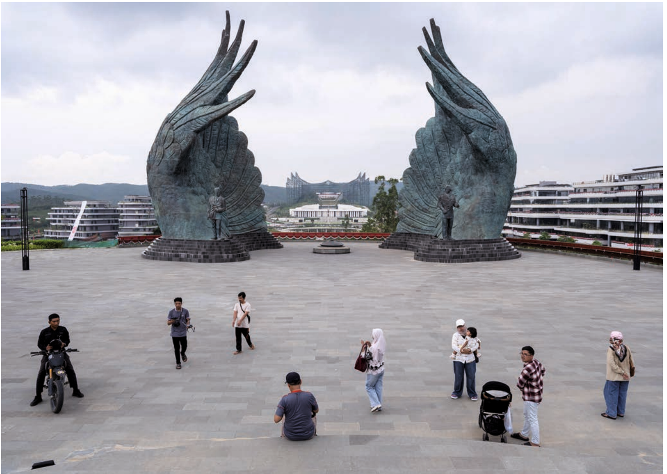
Monumentale Stille: Auf der Plaza Seremoni wirken Besucher ziemlich verloren.